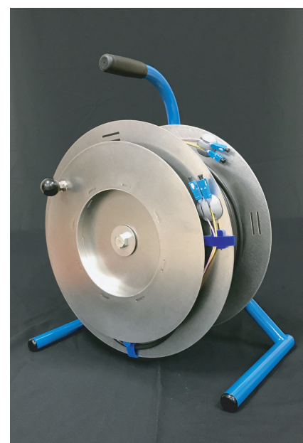
写真 1 100m巻