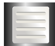
ハーフサイズ カードクリーナ