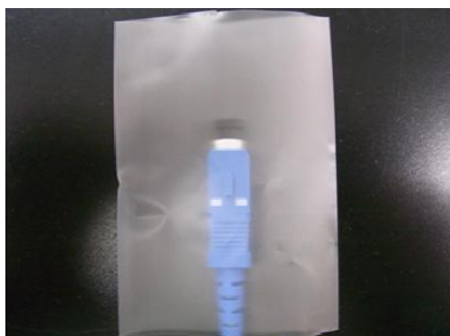
変更後の梱包材：(高密度ポリエチレン)