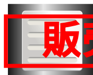
ハーフサイズ カードクリーナ